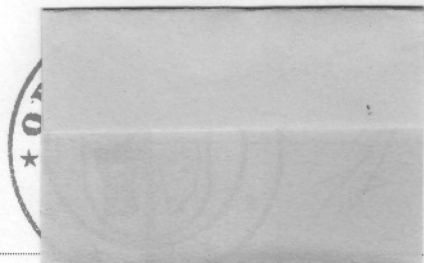
Tibor Balyo Starosta Obce Ivanice