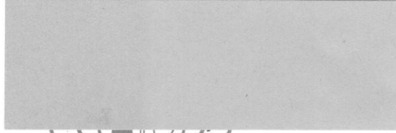
Balogiványi Község (Obec Ivanice) Támogatott